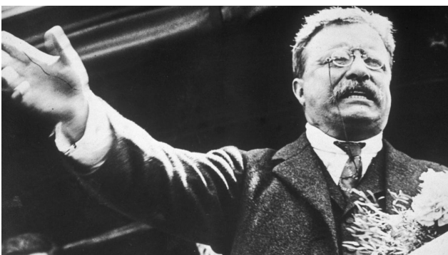
ธีโอดอร์ โรสเวลต์ (Theodore Roosevelt)

รายงานฉบับนี้จัดทำขึ้นโดยข้อมูลเท่าที่ปรากฏและเชื่อว่าเป็นที่น่าเชื่อถือได้แต่ไม่ถือเป็นภาระยืนยันความถูกต้องและความสมบูรณ์ของข้อมูลนั้นๆ โดยบริษัทหลักทรัพย์ ยูเอสบี เคย์ เฮียน (ประเทศไทย) จำกัด (มหาชน) ผู้จัดทำขอสงวนสิทธิ์ในการเปลี่ยนแปลงความเห็นหรือประมาณการในสิ่งที่ปรากฏในรายงานฉบับนี้ โดยไม่ต้องแจ้งล่วงหน้า รายงานฉบับนี้มีวัตถุประสงค์เพื่อใช้ประกอบการตัดสินใจของนักลงทุน โดยไม่ได้เป็นการชี้แนะชักชวนให้นักลงทุนทำการซื้อหรือขายหลักทรัพย์ หรือตราสารทางการเงินใดๆ ที่ปรากฏในรายงาน